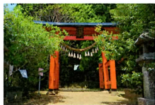
・上野神社 赤い鳥居がトレードマーク。悪縁切りの神様である事解男命・速玉男命が祀られています。