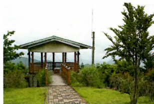
・展望台 町内を見渡せる展望台。キャンプ場より車で10分。